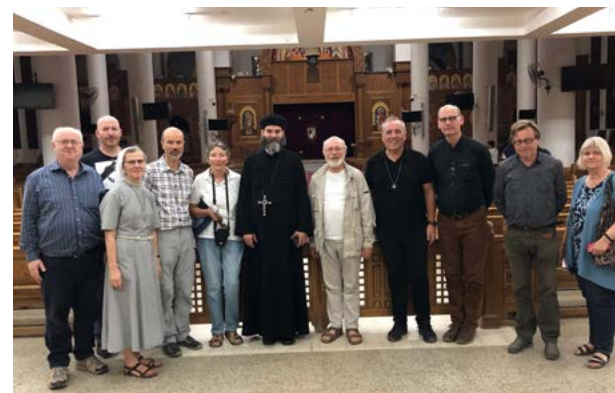
Die Reisegruppe mit einem Priester in Assuan

Ich habe eine lebendige koptische Kirche erlebt, in der die Anbetung des Dreieinigen Gottes in aller Schönheit gelebt wird und das Evangelium in den verschiedenen Altersgruppen entsprechend gelehrt wird. Klöster sind die Lungen der Kirche. Die darin gelebte Spiritualität lässt andere zu den Kraftquellen finden und ein eigenes spirituelles Leben in ihrem Alltag aufbauen.