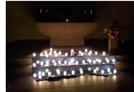
Gebet im Ordenshaus: für jedes Land eine Kerze

Doch „allein den Betern kann es noch gelingen“, hat Reinhold Schneider 1936 in einem Sonett festgehalten – und in dieser Gewissheit sind