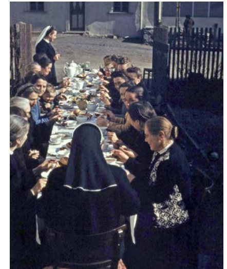
Kaffee-Tafel mit ersten Tertiären