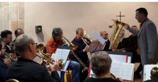
musikalische Unterstützung durch den Projektchor „Bläsergilde“