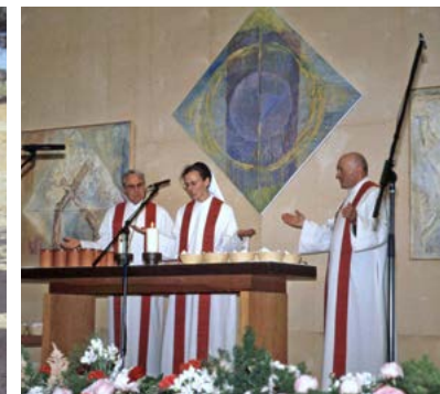
Festgottesdienst zum 50. Jubiläum