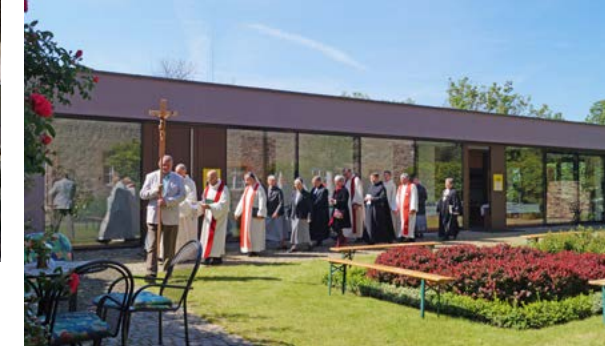
Einzug zum Gottesdienst