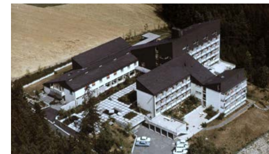
Gästehaus nach der Einweihung 1968