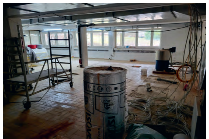
... und so sieht es noch in der „Waschküche“ aus