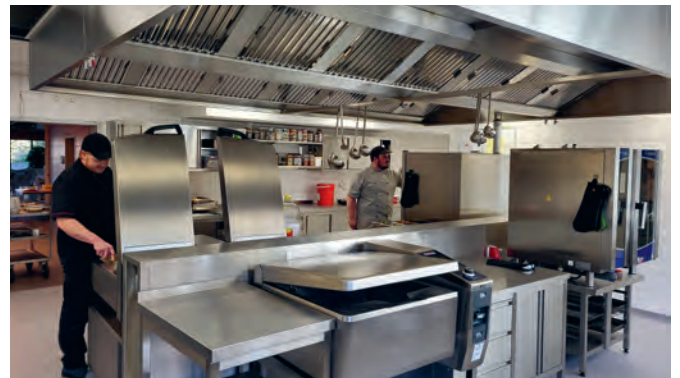
die neue Großküche mit unseren beiden Köchen