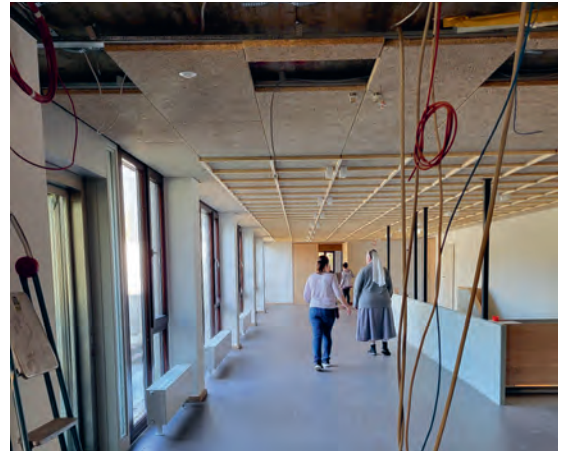
Zugang zu den Speisesälen